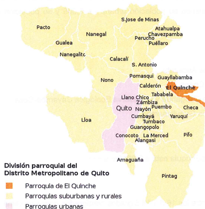
fig1. Mapa cantonal Quito y sus Provincias Rurales. DISTRITO METROPOLITANO DE QUITO

Mapa ubicación cantonal quito y sus parroquias rurales