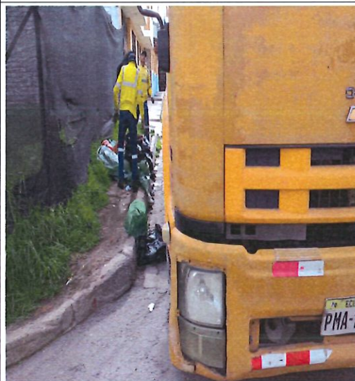
CALLE LÍNEA FÉRREA Y CUENCA