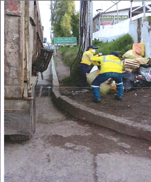
CALLE CUENCA Y E35 "MERCADO DE EL QUINCHE"