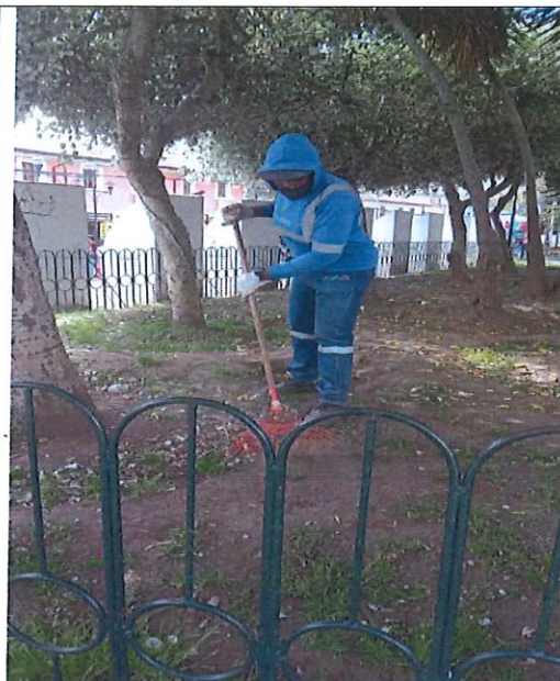
PARQUE CENTRAL DE EL QUINCHE